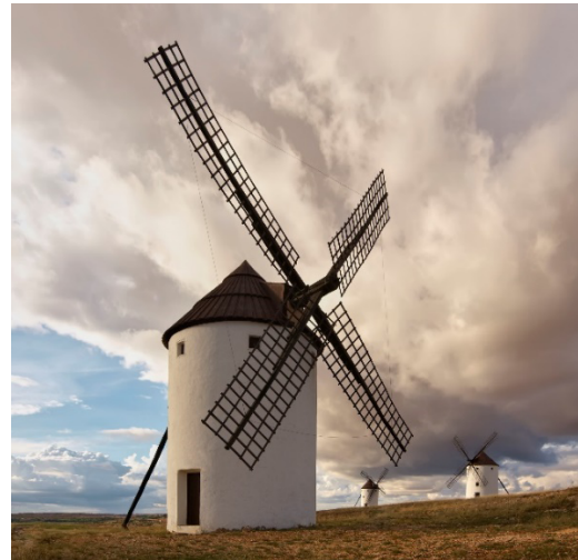
La Mancha

La peripècia vital de Shakespeare i Cervantes no té grans coses en comú, no obstant l'entorn europeu és el mateix, i crida poderosament l'atenció l'aparició de dos genis de la literatura en un moment on Europa també és capaç de generar l'inici de l'òpera, l'aparició del baix continu en la